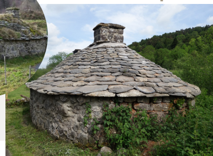
Le four de La Portale Vernols