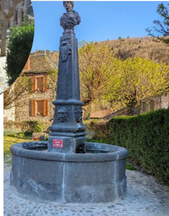
La fontaine Ferrières-St-Mary