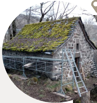
Le moulin de la Chevade Murat