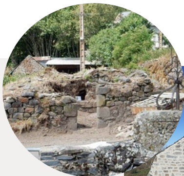
Le Four à pain de Villas Ségur-les-Villas