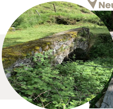
Le pont de Saint-Anastasia Neussargues en Pinatelle