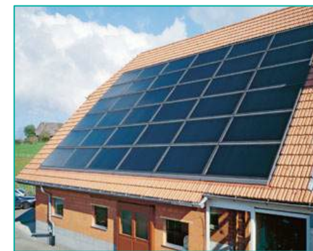
Panneaux photovoltaïques intégrés