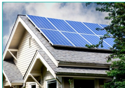
Panneaux photovoltaïques en surimposition