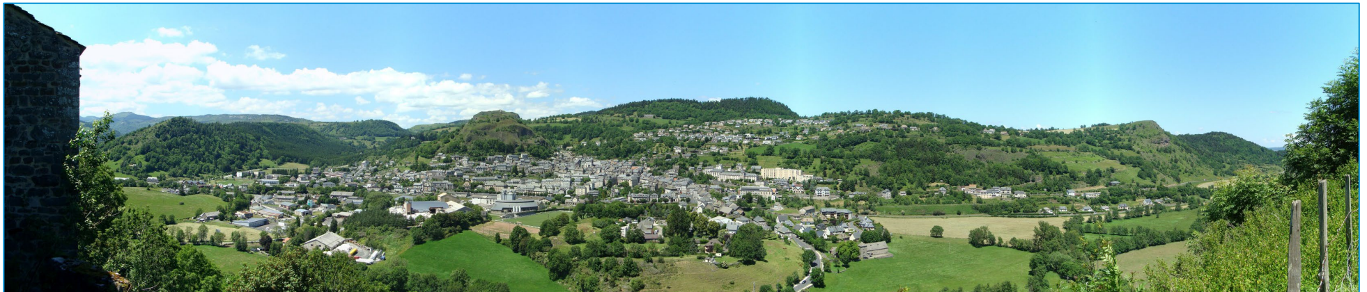
Vue de Murat depuis la chapelle de Bredons

En termes d'organisation urbaine, Murat se structure autour du bourg et de quelques villages et hameaux tels que Chastel-sur-Murat, la Chevade et la Denterie.