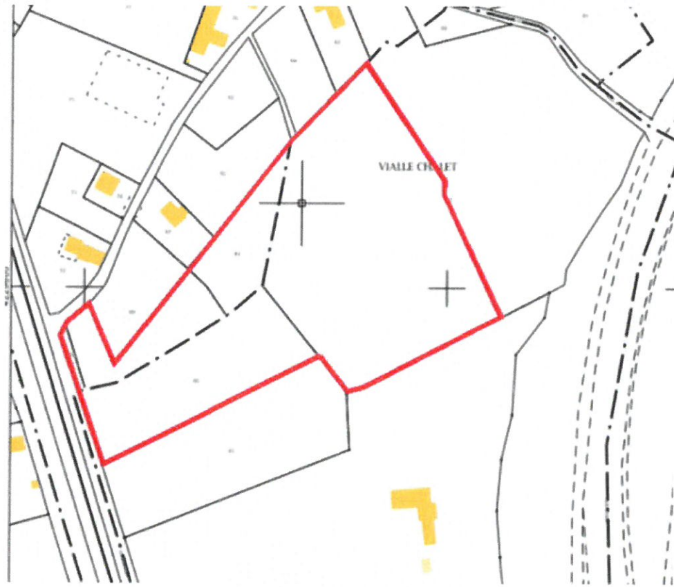
Carte 1 : Plan cadastral initial de la zone

SARL BRUN BRUNO ARCHITECTE D.P.L.G. 113 bis, Avenue de la Libération 63000 CLERMONT-FERRAND Tél : 04 73 92 82 44 architecte@brunbrun.fr www.brunbrun.fr Siret 442 147 501 00056 APE 7121Z